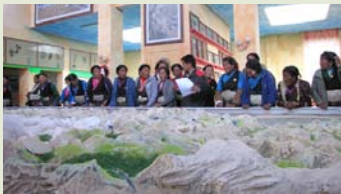
培训中心的珠峰自然保护区沙盘