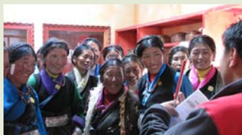
为潘得巴学员介绍珠峰保护区内的本地藏族文化

为了能在竞争激烈的旅游行业中保护老百姓自身的利益，能让当地百姓有效地参与到旅游开发建设中，他殷切希望“潘得巴”协会能够把这样的培训持续不断地开展下去，使得当地百姓参与到旅游开发中，并从中受益，实现保护与发展协调并进。嘎玛局长还希望大家成为民族文化的传播者和保护者。