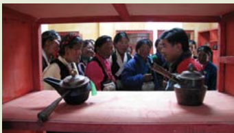
培训中心藏式器具展厅