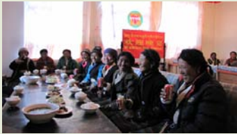
培训中心餐饮服务