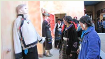
培训中心藏族服饰展厅