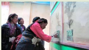
学员津津有味地观看珠峰保护区植物标本