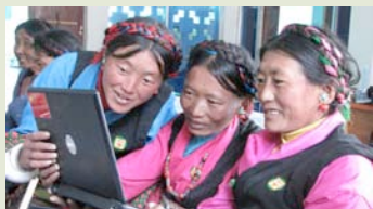
潘得巴培训学员在电脑前观看珠峰旅游宣传片