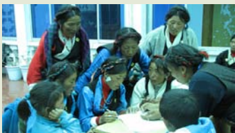
培训中心进行“潘得巴”项目培训