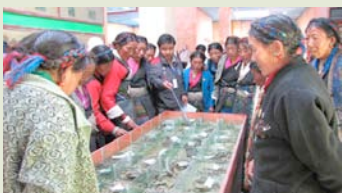
为学员介绍保护区内的植物物种