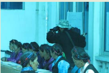
西藏电视台专赴培训现场报道 “潘得巴”

通过培训，学员们基本掌握了协会所安排的全部课程，对珠峰保护区的管理和建设状况、妇幼卫生保健、家庭创收、生态旅游与服务等领域有了进一步的了解。此次培训效果较为明显。